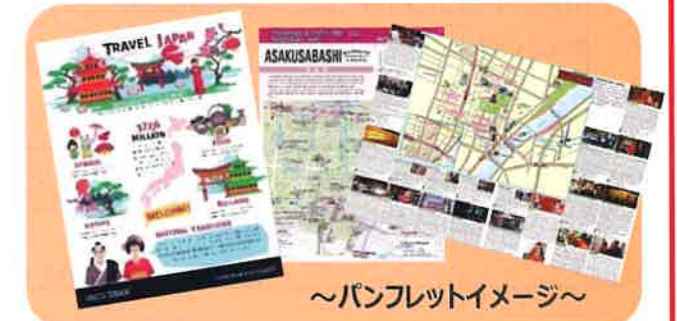
～パンフレットイメージ～