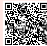
欠席連絡フォーム