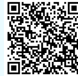
欠席連絡フォーム